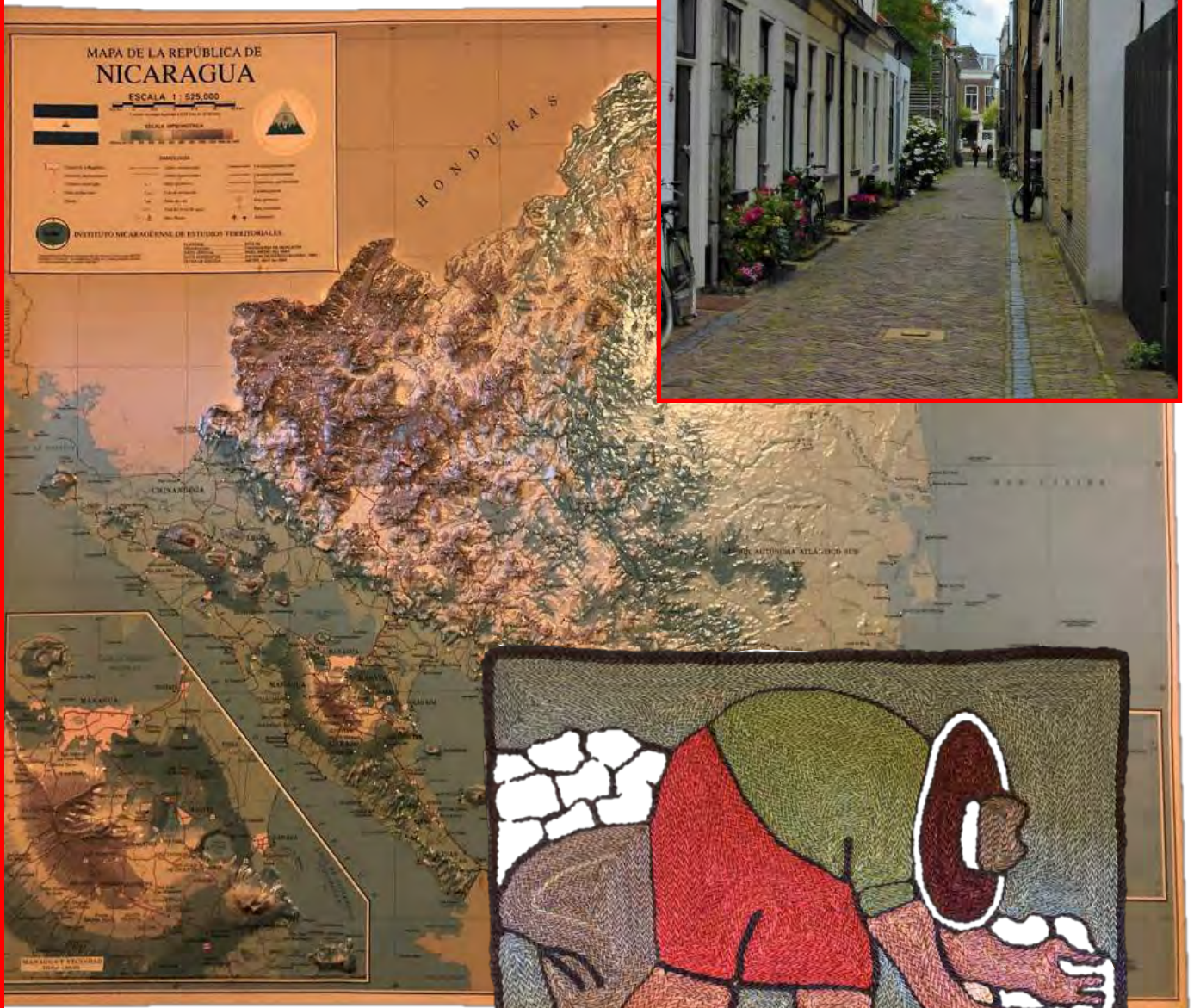
Reliefkarte von Nicaragua.