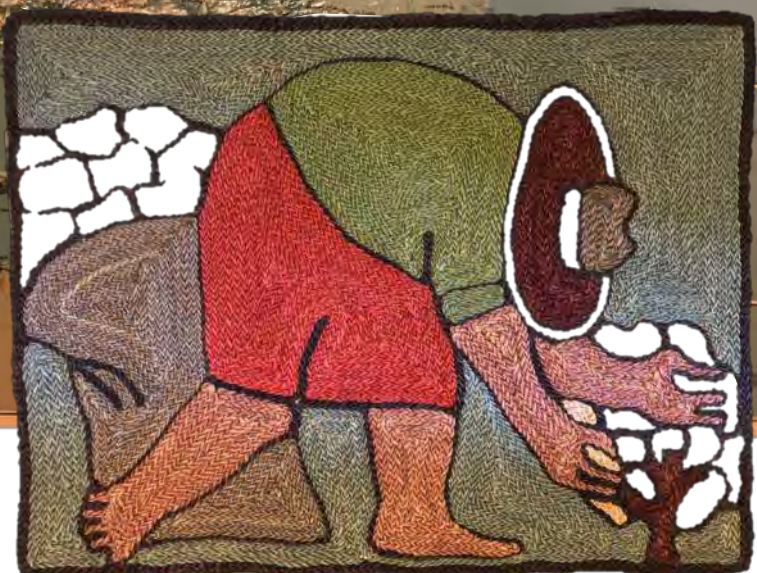
Baumwollpflücker aus Masaya (Nicaragua).